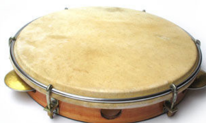
pandeiro feito com pele de plástico