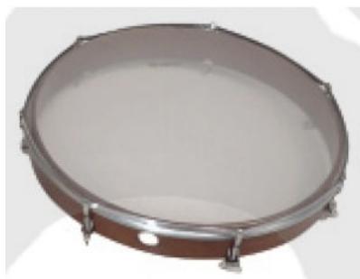
pandeiro feito com pele de animal

Pandeiro é um instrumento de percussão que consiste numa pele esticada em uma armação estreita. No Brasil, a palavra “pandeiro” veio a designar um pandeiro específico, de dimensões que variam de 20 a 30,5 centímetros, muito usado no samba, mas não se limitando a esse ritmo, sendo encontrado no baião, côco, maracatu e por isso é considerado o instrumento nacional do Brasil.