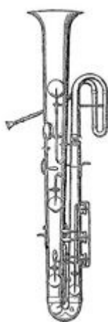
Oficleide, o antecessor da tuba